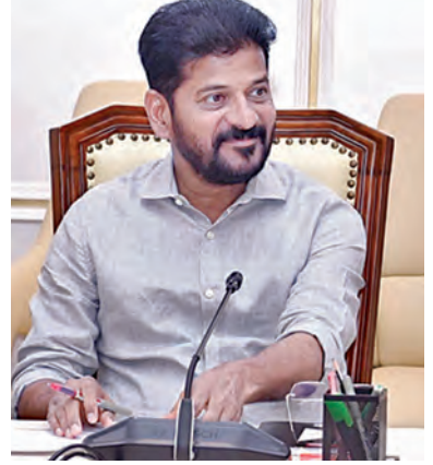
ప్రభాతవార్త ప్రధాన ప్రతినిధి, హైదరాబాద్, నవంబరు 22: ఉద్యోగాల భర్తీలో కొత్త రికార్డు నమోదు చేసినట్లు రేవంత్ ప్రభుత్వం ప్రకటించింది. ప్రజా పాలనలో తెలంగాణ యువత