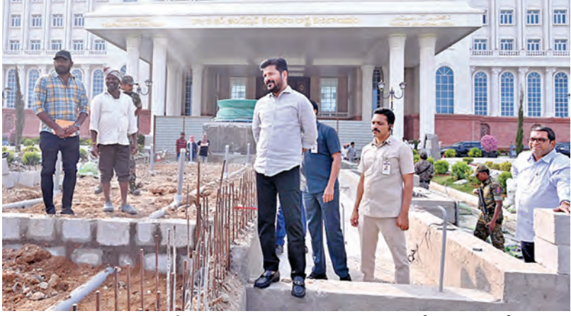
శ్రీకాకుళం సచివాలయంలో తెలంగాణ తల్లి విగ్రహవిష్కరణ పనులను పరిశీలిస్తున్న సీఎం రేవంత్