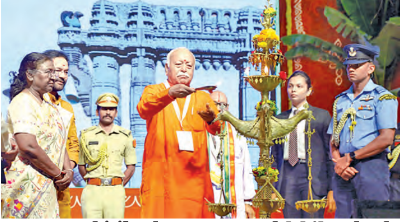
శ్రీకాకుళం ప్రాంతాధికారి లోక్మంధన్ కార్యక్రమాన్ని ప్రారంభిస్తున్న ఆర్ఎన్ఎస్ఐ చీఫ్ మోహన్ భగవత్